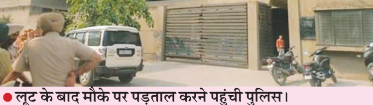
● लूट के बाद मौके पर पड़ताल करने पहुंची पुलिस।

जानकारी के मुताबिक फोकल प्वाइंट के फेज सात स्थित फेहरनहाइट क्लोदिंग कंपनी की यूनिट में वर्करो का वेतन बांटने के लिए 16 लाख की नगदी मंगवाई गई थी। बताते हैं कि दिन के ही समय बेखौफ छह हथियारबंद बदमाशों ने इस वारदात को अंजाम