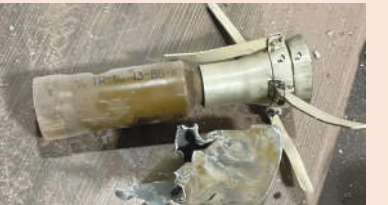
मौके पर मिला लॉन्चर ग्रेनेड