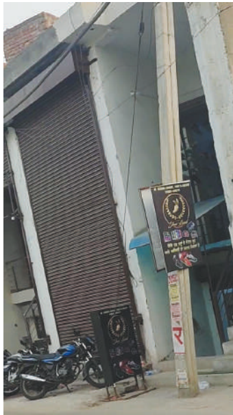
● जूता कारोबारी का आफिस, दुकान-गोदाम, जहां डीआरआई ने रेड की।

लुधियाना/यूटर्न/11 मई। देश के पोर्ट्स पर ड्रग्स की खेप मिलने के मामलों के तार शायद औद्योगिक नगरी से जुड़े हैं। तभी जूतों के कारोबार की आड़ में नशे का धंधा किए जाने की पुख्ता जानकारी मिलने के बाद डायरेक्टोरेट आफ रेवेन्यू इंटेलेजेंस यानि डीआरआई ने साहनेवाल एरिया में छापेमारी की। इस कार्रवाई में जूतों के गोदाम से बड़ी तादाद में नशीला पदार्थ और कैश मिलने पर कारोबारी व उसके कारिदों को हिरासत में ले लिया गया। हालांकि विभागीय स्तर से इसकी अधिकारिक पुष्टि नहीं की गई। जानकारी के मुताबिक यह लंबी कार्रवाई मंगलवार करीब सुबह दस से लेकर रात ग्यारह बजे तक चली। हालांकि डीआरआई की इस कार्रवाई की स्थानीय पुलिस तक को भनक नहीं लगने दी गई। जबकि पूरी कार्रवाई के दौरान मीडिया कर्मियों को भी पास नहीं आने दिया गया। सूत्रों के मुताबिक साहनेवाल के रामगढ़ चौक के पास जूता कारोबारी की दुकान की कई दिन से विभागीय टीम द्वारा रेकी कराई जा रही थी। फिर अचानक कल सुबह कई कारों में सवार होकर विभागीय टीम के अधिकारियों ने दुकान में रेड कर दी। सूत्र बताते हैं कि गोदाम में छापामारी करके 55 किलो नशीला पदार्थ बरामद किया गया। जो यहां बनने वाले सूटकेस के नीचे छिपाया था, उनको उधेड़कर जप्त कर लिया गया। इसके अलावा करीब 25 लाख रुपये भी जप्त किए गए।