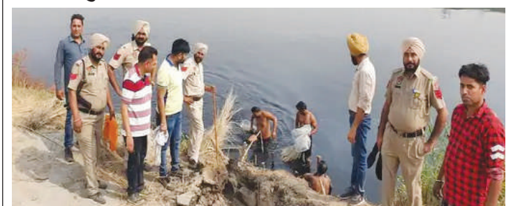
● बेट इलाके में सतलुज दरिया से लाहन बरामद करती एक्साइज महकमे की टीम

दरिया में छिपाए थे ड्रम, एक्साइज टीम पहुंचने की भनक लगते ही तस्कर फरार