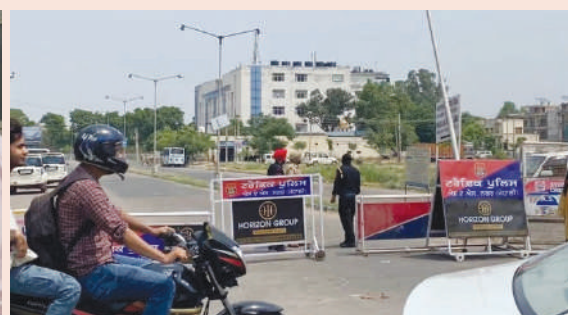
मोहाली स्थित इंटेलिजेंस हेडक्वार्टर हमले के बाद कड़ी नाकाबंदी, जांच एजेंसियों के पहुंचने का सिलसिला अब भी जारी।