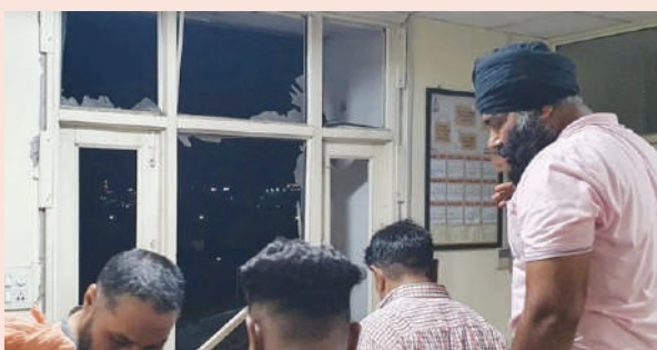
हमले के तत्काल बाद इमारत के क्षतिग्रस्त हिस्से में जांच करती टीम।

दिल्ली पुलिस की स्पेशल सैल क्यों आई... सैल यह जांच करेगी कि हमले में रॉकेट प्रोपेलंड ग्रेनेड यानि