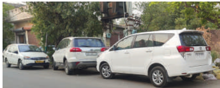
● रेड करने आई डीआरआई टीमों की गाड़ियां।