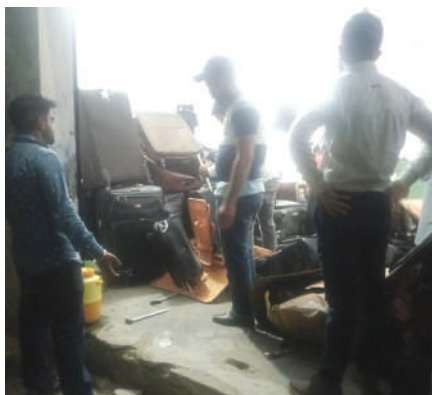
● कर दिया ढेर...डीआरआई टीम ने जिन सूटकेस को उधेड़कर उनसे नशीले पदार्थ की खेप बरामद की, जूता-गोदाम के बाहर लगा उनका ढेर